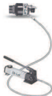
Hydrauliczne urządzenie do zaciskania