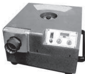
Elektryczne urządzenie do zaciskania